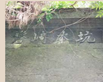
⑱常磐炭礦磐崎礦本坑坑口