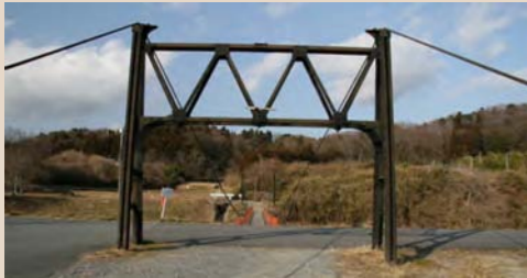
⑤通勤用吊り橋(松坂)