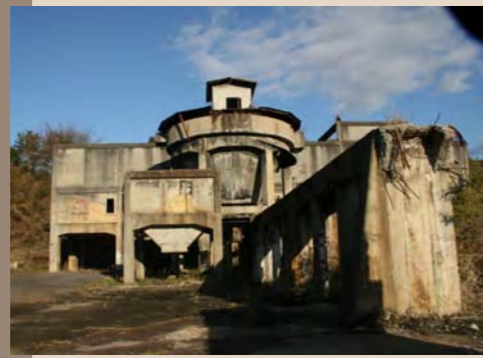
⑨常磐炭礦内郷礦中央選炭工場