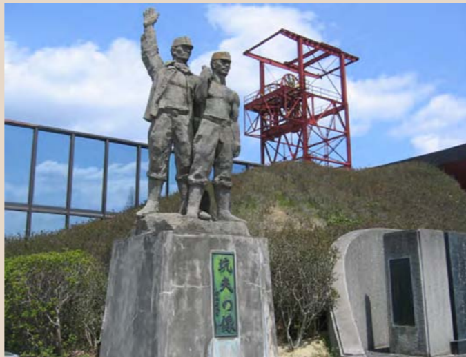
⑭いわき市石炭・化石館(愛称ほるる) 竪坑櫓・産業戦士の像(「総決起」) 昭和天皇御製の碑

ここがいわき地域の石炭の終焉の地です。長く常磐炭礦(株)の本拠地として選炭場や石炭を積み出した万石を有し、専用鉄道を通じて湯本駅から石炭を出荷しました。「いわき市石炭・化石館(愛称ほるる)」はこの地で1984(昭和59)年に開館しました。