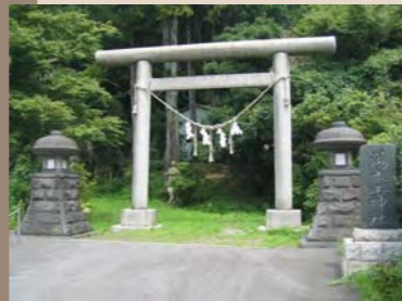
⑰炭鉱(ヤマ)の守り神湯本山神社