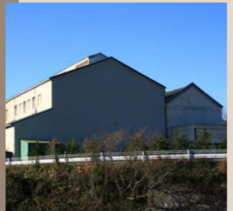
②古河好間炭礦火力発電所