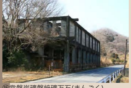
⑲常磐炭礦磐崎礦万石(まんごく) (手前の道路は旧専用鉄道、後方にズリ山が見える)