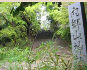
⑦安全を祈願した内郷山神社(現在の内町公園)

石炭発見の地として早くから多くの炭鉱が進出し常磐炭田の中心でしたが、昭和30年代に採掘は終了しました。ここでは白水仙と宮川流域の谷間に沿って石炭が採掘され、それに付随した炭鉱施設、山神社、人馬が石炭を運んだ山道、住宅、商店街の移り変わりや盛衰が見られる所です。