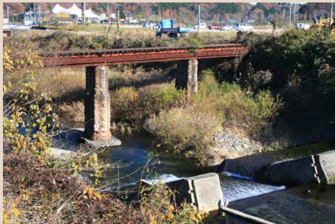
①古河好間炭礦専用鉄道橋梁

古河好間炭礦(株)があった北好間と内郷駅を結ぶ専用鉄道の遺構は常磐炭田随一です。又職場と住宅を結ぶ三つの吊り橋や炭住、戦時中に作られた産業戦士像やズリ山があります。