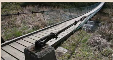
④通勤用吊り橋(大畑)