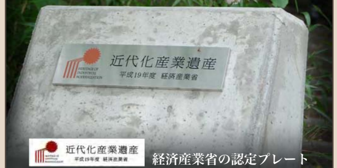
内郷山神社(現在の内町公園)に置かれた認定プレート

経済産業省では、近代化産業遺産の保存・活用を一層進める観点から、33の近代化産業遺産群を構成する個々の近代化産業遺産を地域活性化に役立つ資産として認定し、その所有者の方々に対し、認定証及びプレートを交付しています。