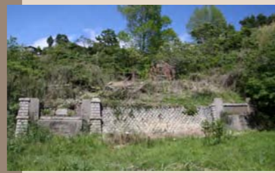
⑪石造りの住吉一坑坑口