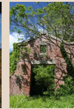
⑩赤煉瓦の扇風機上屋