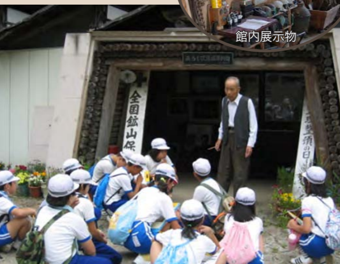
⑧石炭発見の地にある「みろく沢炭鉱資料館」での学習