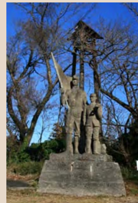
③産業戦士の像(「進発」)